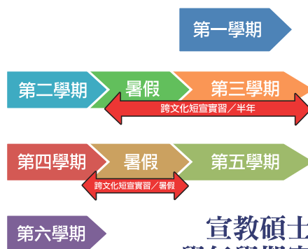
宣教學士科 學年學期實習表